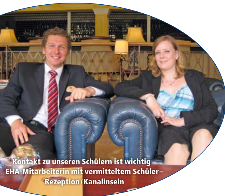
Kontakt zu unseren Schülern ist wichtig – EHA-Mitarbeiterin mit vermitteltem Schüler-Rezeption / Kanalinseln

Genauere Angaben zu den Verdienstmöglichkeiten findet man in unserem Handbuch. Die Arbeitgeber zahlen den landesüblichen Lohn. Durch das Einkommen kann das Leben vor Ort finanziert werden, reich wird man jedoch nicht. Wenn der Bewerber in Deutschland eine eigene Wohnung weiter finanzieren möchte oder monatliche Schulden abbezahlen muss, ist das Programm nicht geeignet.