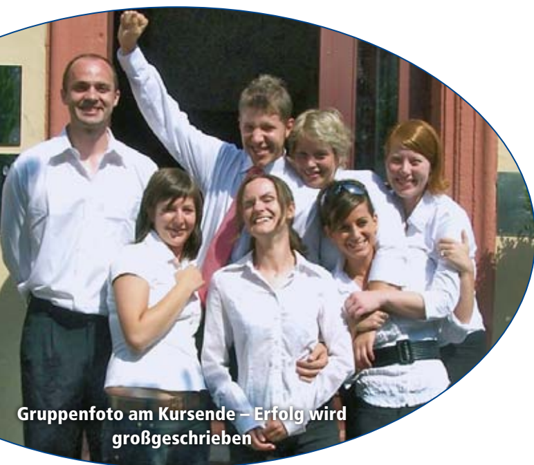
Gruppenfoto am Kursende – Erfolg wird großgeschrieben

In Ausnahmefällen gibt es die Möglichkeit einer individuellen Förderung durch eine von der zuständigen Agentur für Arbeit beantragten Einzeltrainingsmaßnahme. Dies kommt für Bewerber in Betracht, die zu einem außerhalb der QM-Daten liegenden Zeitpunkt zu uns kommen möchten. Gerne beraten wir unsere Bewerber auch bezüglich des Bildungsgutscheines.